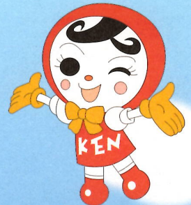
人権イメージキャラクター 「人KENあゆみちゃん」