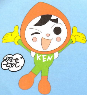
人権イメージキャラクター 「人KENまもる君」